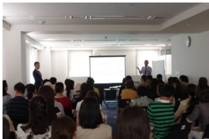
講演を聞き入る参加者