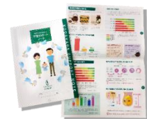
中医学で妊娠力を高める 「子宝サポートノート」