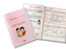
すやかなマタニティライフと 元気に出産育児をするための 「マタニティノート」

*1 ※「ドゥーラ」の語源は、ギリシャ語で「他の女性を支援する、経験豊かな女性」という意味です。