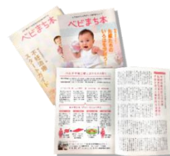
妊活情報マガジン「ベビまち本」