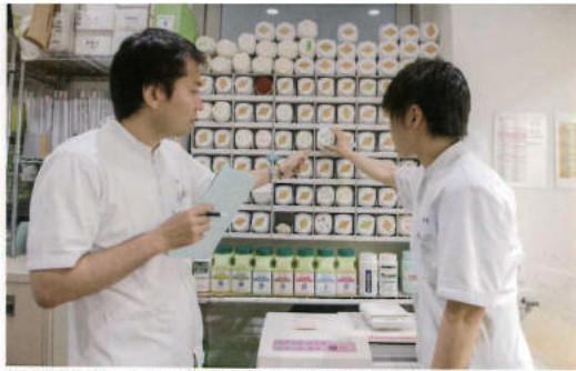
カルテを見ながら、1人1人の症状に合わせて、漢方薬をお選びします