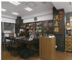
銀座店は、漢方薬と鍼灸、両方の治療が受けられる併設型の店舗。そのほかに蒲田店、浅草橋店、人形町店など多くの店舗を展開しています

・漢方館 人形町店・コンフォートブルック新浦安店・鍼灸院爽快館 学芸大学店・鍼灸院爽快館 自由が丘店・鍼灸院爽快館 西葛西店・鍼灸院爽快館 新浦安店・鍼灸院爽快館 船橋北口店・鍼灸院爽快館 津田沼店・鍼灸院爽快館 妙典店・鍼灸院爽快館 蒲田店