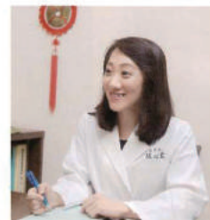
現在の症状や気になる点などを確認しながら、体の状態を診断します。多くの経験が蓄積している舌を診る「舌診」で内臓の状態もわかります

当院独自の治療法には、①周期調節法 ②三焦調整法 ③補腎の3つの柱があります。一つ目の周期調節法とは、女性の生理の周期を「月経期」「排卵期」「排卵