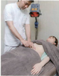
施術は、遠赤外線を体を通りながら行います。下腹部への鍼で子宮や卵巣などに血流を調整します

期(黄体期)の4つに分け、周期によってホルモンの状態が変わるので、それぞれに合わせた漢方薬を処方します。また、一人一人の体質や体調にも配慮します。 二つ目の三焦調整法とは、鍼灸による治療です。「三焦」とは、頭からみぞおちまでの「上焦」、みぞおちからへそまでの「中焦」、へそから足先までの「下焦」による3区分で、これらの血流バランスを整える方法が三焦調整法です。 現代の日本人は、頭を使うことが多いので頭部に血流がたまり、子宮や卵巣に栄養を運んだり、ホルモンを届けたりする血流が不足しがち。このことが現代女性の不妊と大きくかかわっていると考えています。そこで三焦調整法で全体