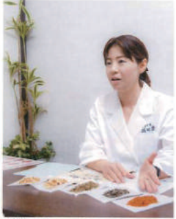
相談後、症状にあった漢方薬の効果や摂取方法についてわかりやすく説明します