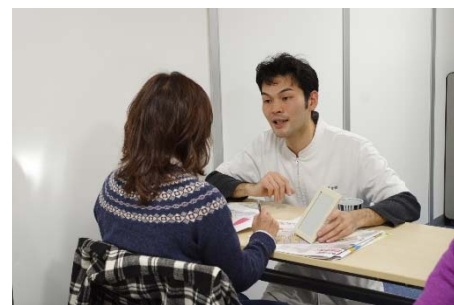
舌の様子から体調を見る「舌診」の体験